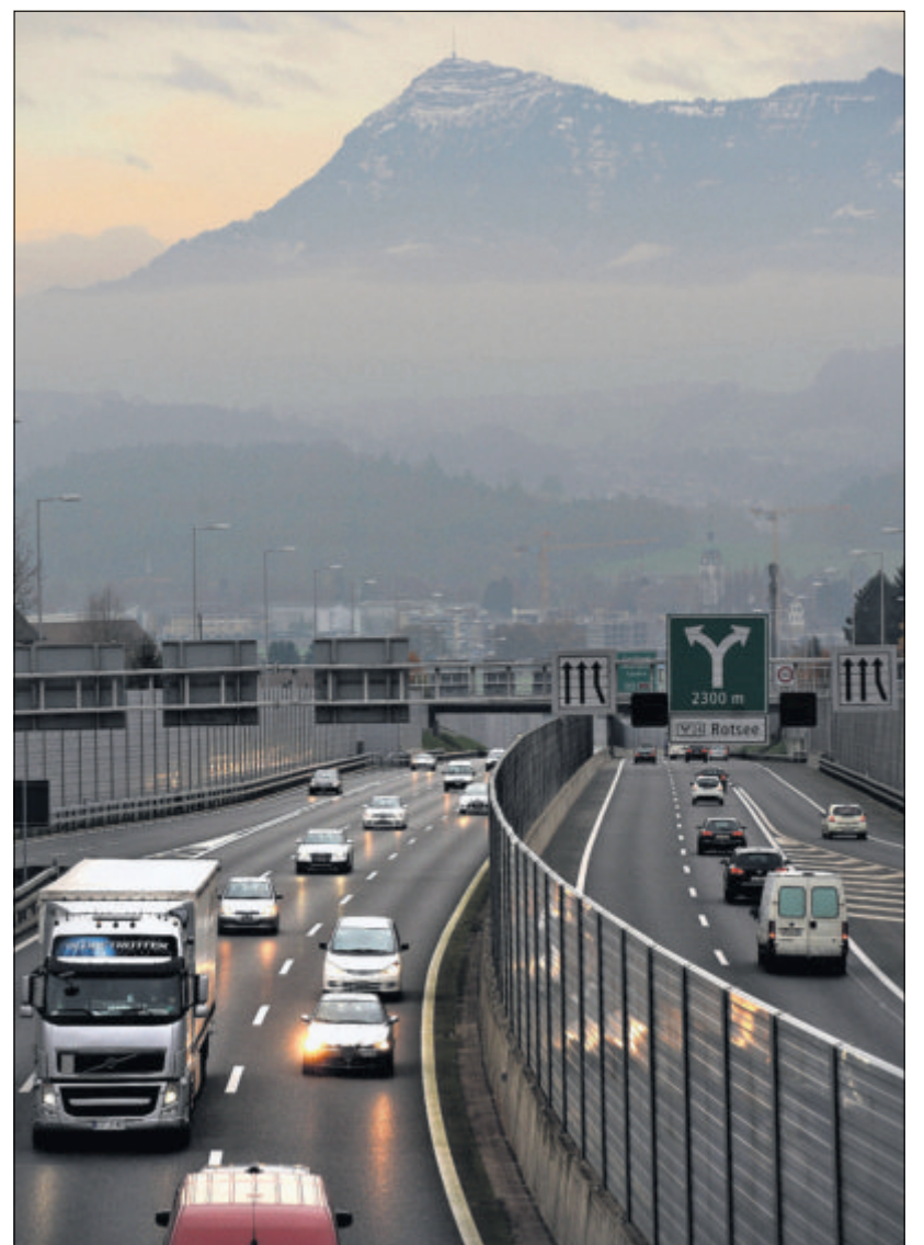
Der Verkehr auf der A 2 bei Emmen nimmt rasant zu. Feierabendverkehr gestern beim Anschluss Emmen Nord.

Grafik: Oliver Marx