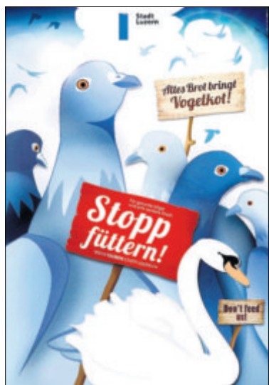
Diese Plakate hängen an fünf Standorten in Luzern.

Dass die Plakate um diese Jahreszeit zum Einsatz kommen, hat einen einfachen Grund: «Bei Wintereinbruch haben die Menschen das Gefühl, sie